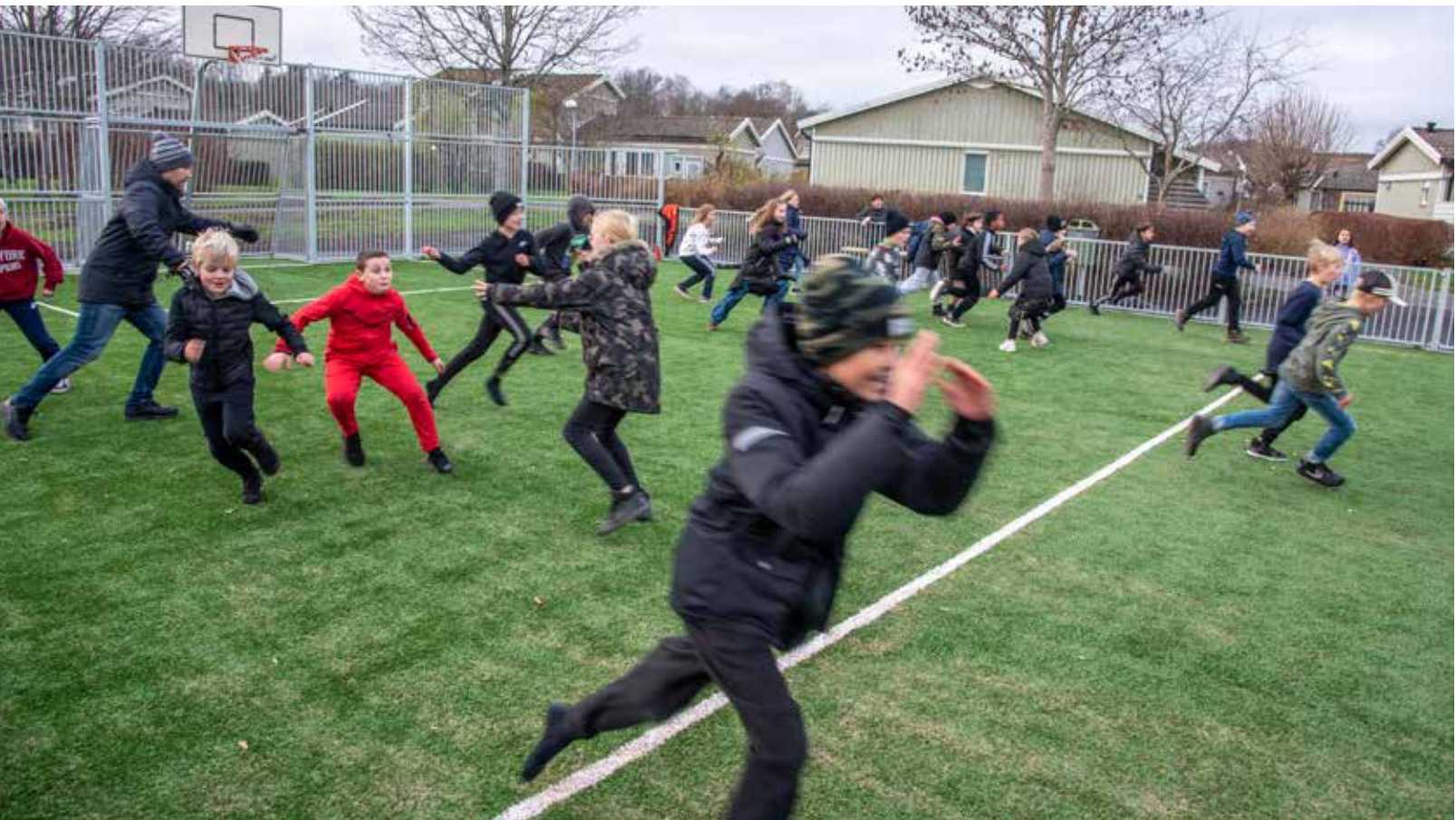
Efter maten fick den nya arenan i Änggården Södra Nol visa vad den går för när fyrorna lekte den populära leken "Slimeklumpen". Det gäller att ta sig förbi klasskompisarna utan att bli fångad, då blir man en slimeklump och är ute ur leken.