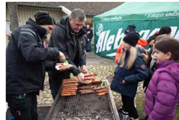
Eleverna bjöds på korv i alla dess former, nypopade popcorn och chokladbollar innan det var dags att hitta på ett namn på den nya arenan.