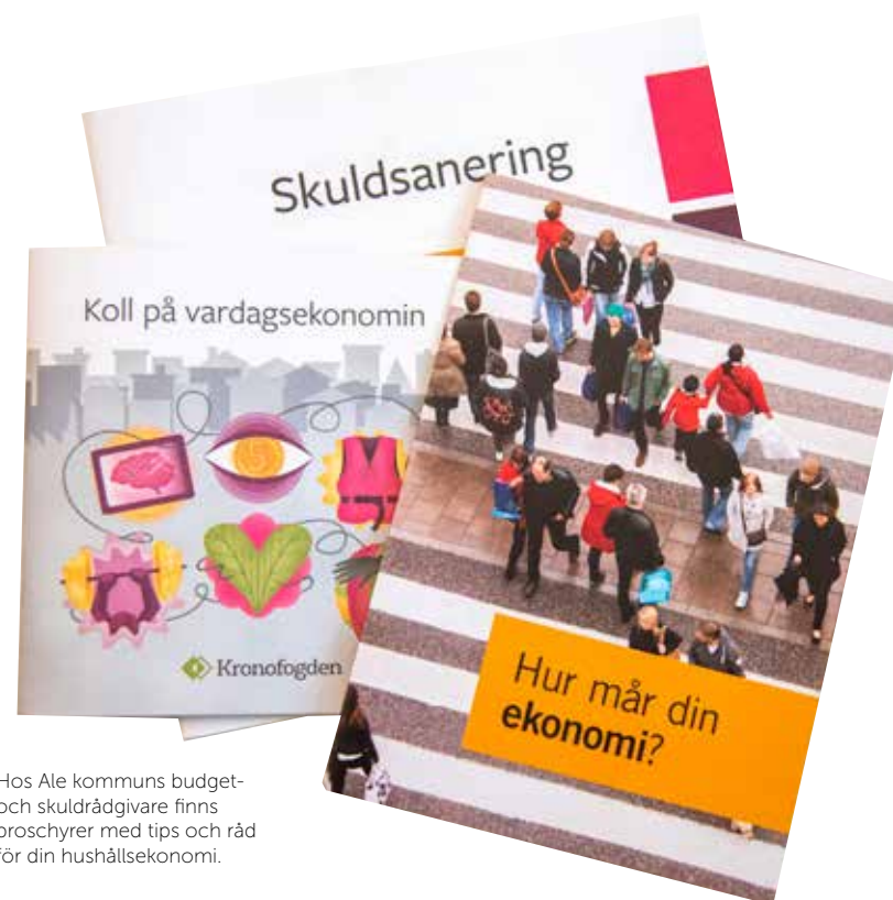
Hos Ale kommuns budget- och skuldrådgivare finns broschyrer med tips och råd för din hushållsekonomi.

utdrag från banken är ett bra sätt att få koll på utgifter. Börja vid datum för löning, och gå igenom post för post för att se vart pengarna går.