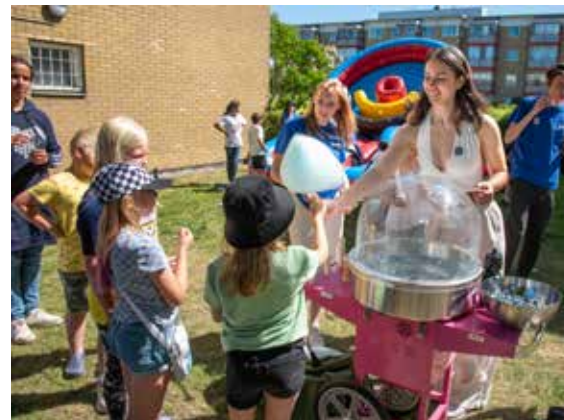
... och kön till det nyspunna sockret slingrade långt.