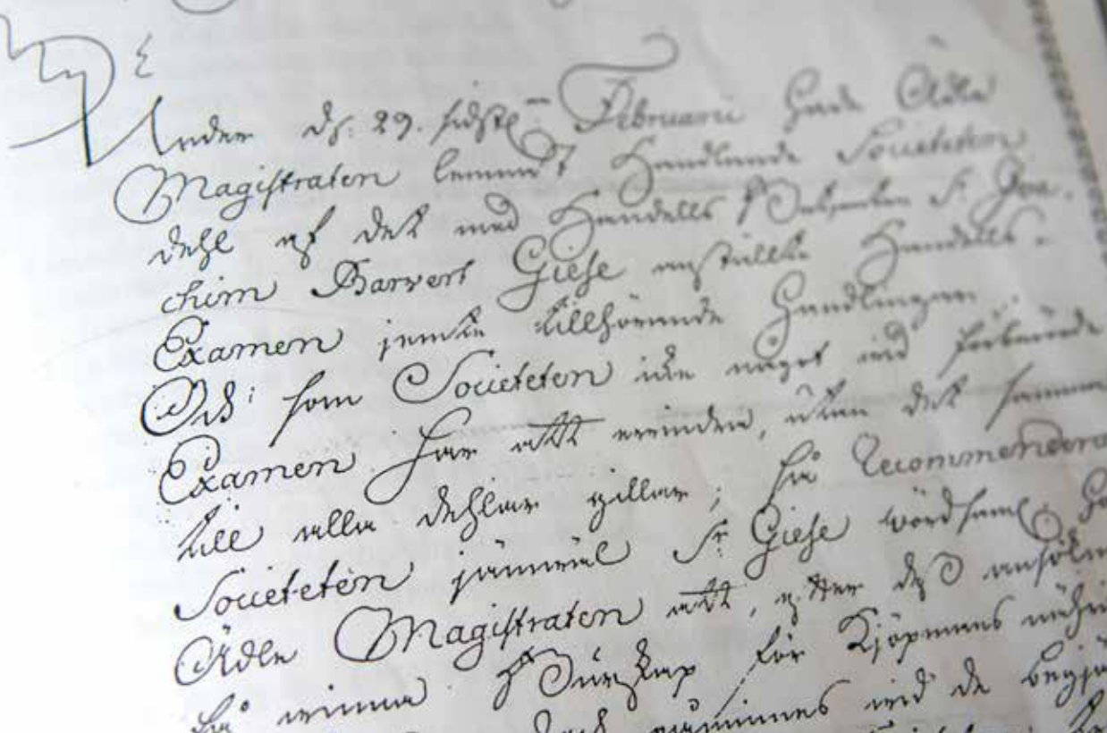
Det är inte alltid så lätt att läsa och förstå äldre källor man stöter på i sin släktforskning. Ale Släktforskare håller kurser i att lära sig tyda äldre skrift. Här ett exempel på en text från 1752.