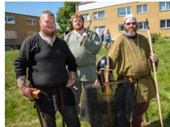
Vikingarna från Ale vikingagårds byalag berättade om hur det var att leva på vikingatiden.