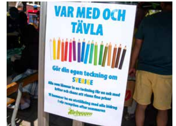
Barnens Sverige-teckningar kommer att ställas ut i Alebyggens reception efter sommaren.