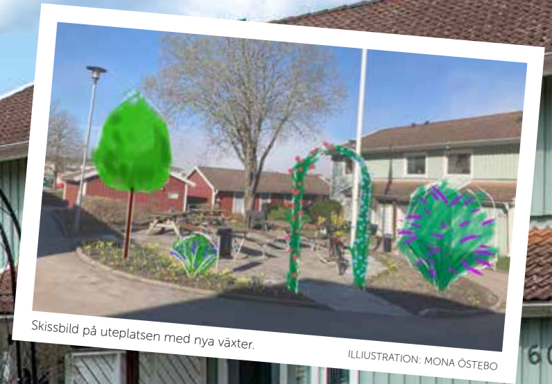
Skissbild på uteplatsen med nya växter.

– Nu ser jag fram emot att få plantera de första växterna. Men riktigt fint blir det nog först nästa sommar, säger Mona Östebo.