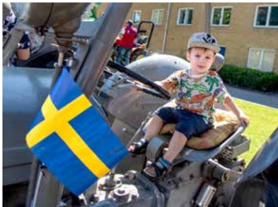
Det var poppis att få sitta i traktorena...